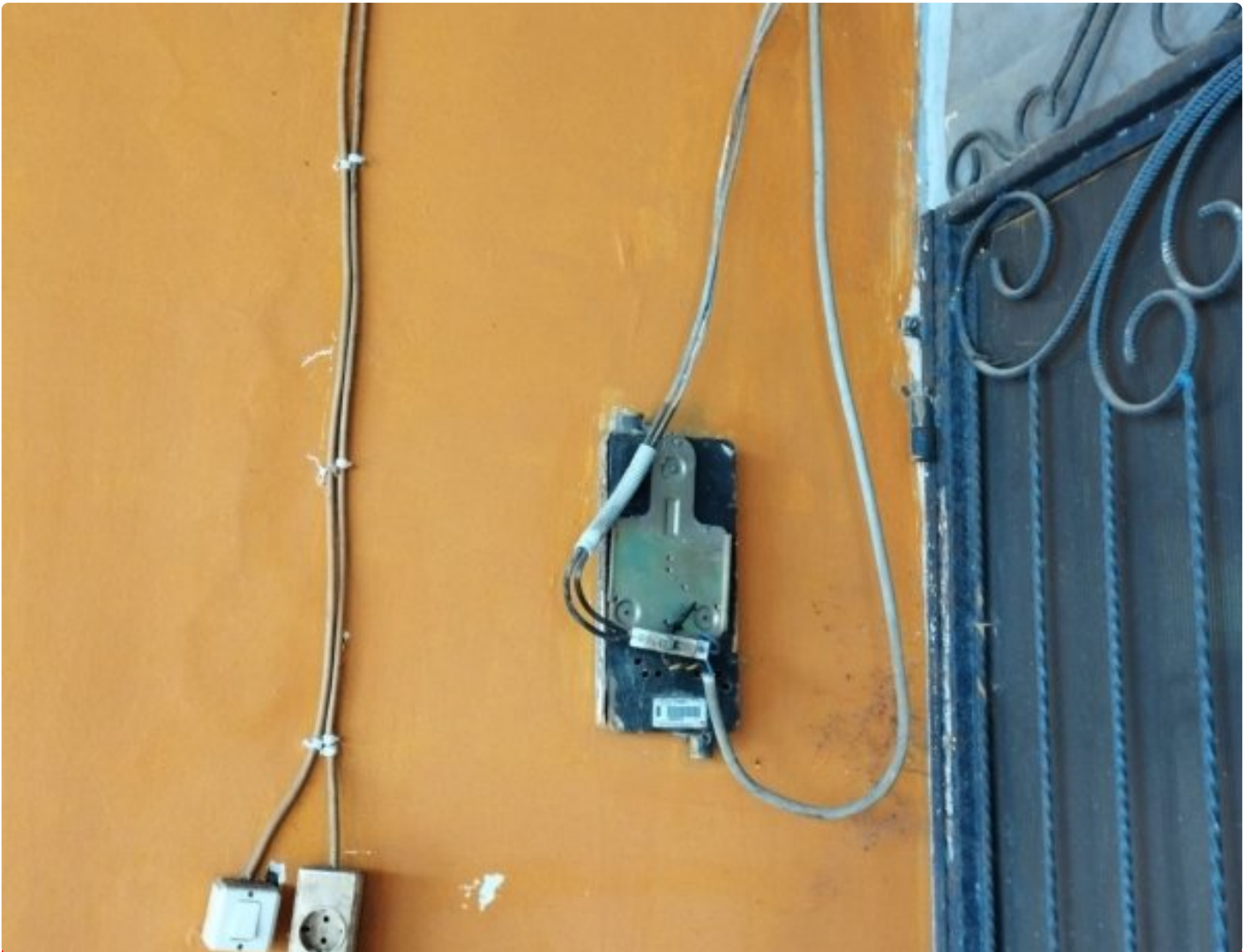
Pemilik Rumah Keluhkan Perbuatan Petugas PLN UP3 Boja Mencabut Meteran, Selasa (16/07/2024).